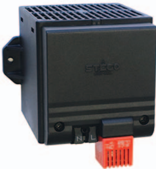
CSF 028 mit Schraubflanschbefestigung