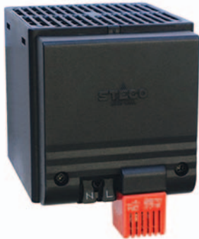
CSF 028 mit Clipbefestigung